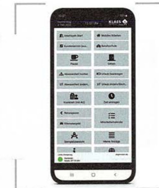
/ Die Zeiterfassung zeigt auch mobil Urlaubstage, Überstunden etc. an.

mizing erheblich. Ein individueller Ausbau ist aber trotzdem möglich. (mm)